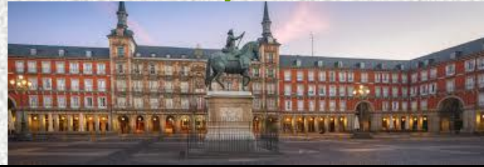
Plaza Mayor de Madrid