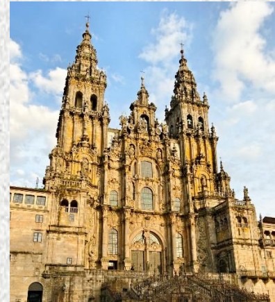
Fachada del Obradoiro en la Catedral de Santiago de Compostela