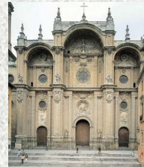
Fachada de la catedral de Granada