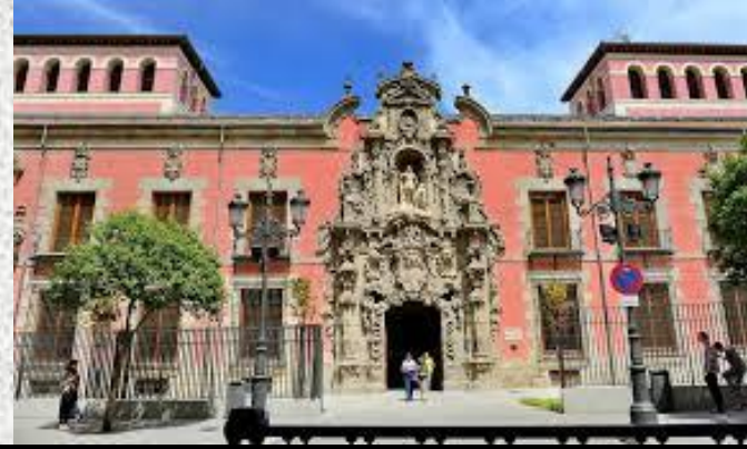
Hospicio de San Fernando de Madrid