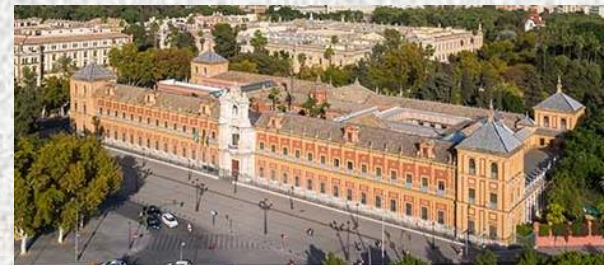
Palacio de San Telmo de Sevilla